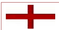
Croce di San Giorgio, la bandiera dell'Inghilterra

L' Union Jack è il simbolo dell'unione delle nazioni all'interno della Gran Bretagna perché comprende le bandiere di ogni singolo stato membro: si tratta infatti di tre bandiere in una, ossia tre nazioni unite in una famiglia. È l'Union Jack, infatti, niente meno che un altro nome per dire " Union flag ". Una trinità di nazioni. Le croci visibili nelle bandiere portano il nome del santo patrono di ogni singola nazione: San Giorgio, patrono dell'Inghilterra, Sant'Andrea, patrono della Scozia e San Patrizio, patrono dell'Irlanda. La bandiera gallese (il drago gallese) non è compresa nell'Union Jack perché il Principato del Galles era già unito all'Inghilterra quando la prima Union Jack fu disegnata nel 1606.