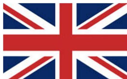
Se sovrapponetevi le tre croci si crea l'Union Jack.