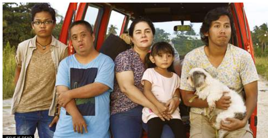
JESUS IS DEAD

Trash For Free is the monthly party in which Rettore holds hands with Cher, while Britney Spears crazily dances with Sabrina Salerno to the rhythm of Smack My Bitch Up and Madonna sips a Martini with Renato Zero at the bar.