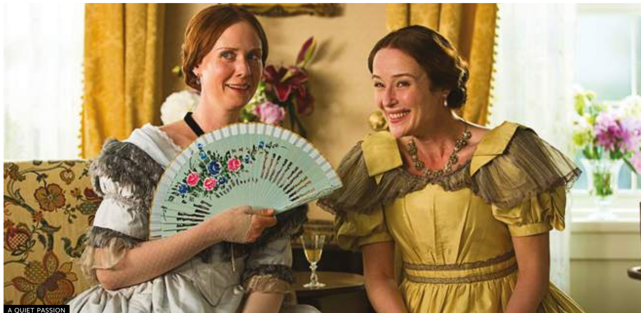
A QUIET PASSION