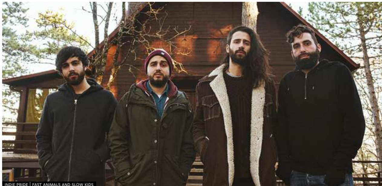
INDIE PRIDE | FAST ANIMALS AND SLOW KIDS