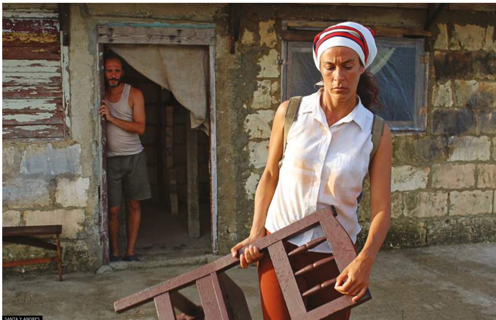
SANTA Y ANDRES