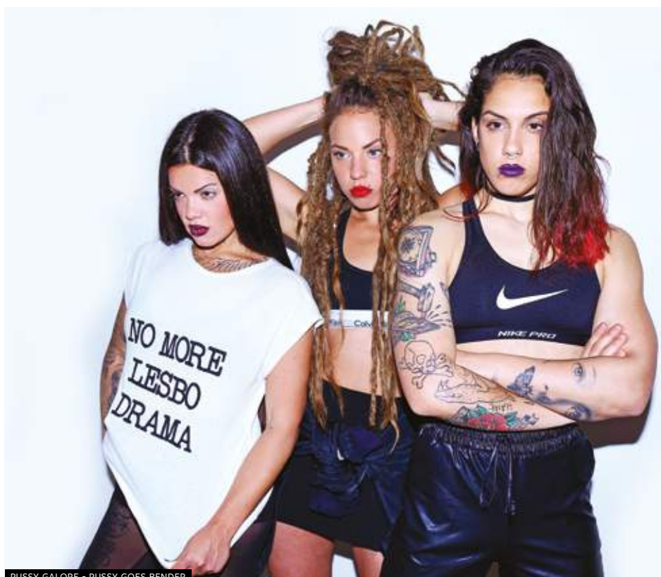
PUSSY GALORE - PUSSY GOES BENDER