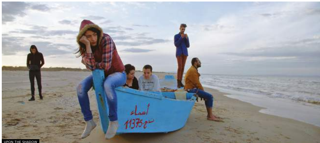
UPON THE SHADOW

Minor Place è una performance che si basa sulla partecipazione del pubblico, che accede allo spazio scenico dando vita a un raduno temporaneo, uno spazio sicuro in cui allenarsi a guardare, a sviluppare empatia, a prendere posizione e ad esporsi. I codici di fruizione del corpo sono rimessi in discussione, la relazione con l'altro scaturisce da un atto di generazione collettiva, da pratiche che innescano un'energia di alleanza. Per partecipare non è richiesta dimestichezza con le pratiche performative. Minor Place asks an active participation to the audience,