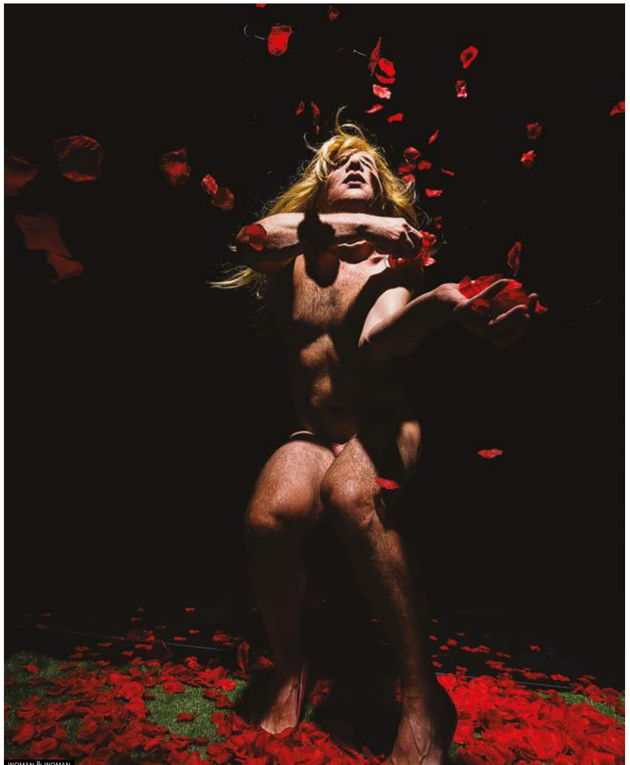
WOMAN & WOMAN

Fast Animals and Slow Kids, Blindur, Espana Circo Este, Cristallo and Management of post op pain: a totally rock line-up for the sixth edition of Indie Pride, the independent music event against homophobia, bullying and sexism.