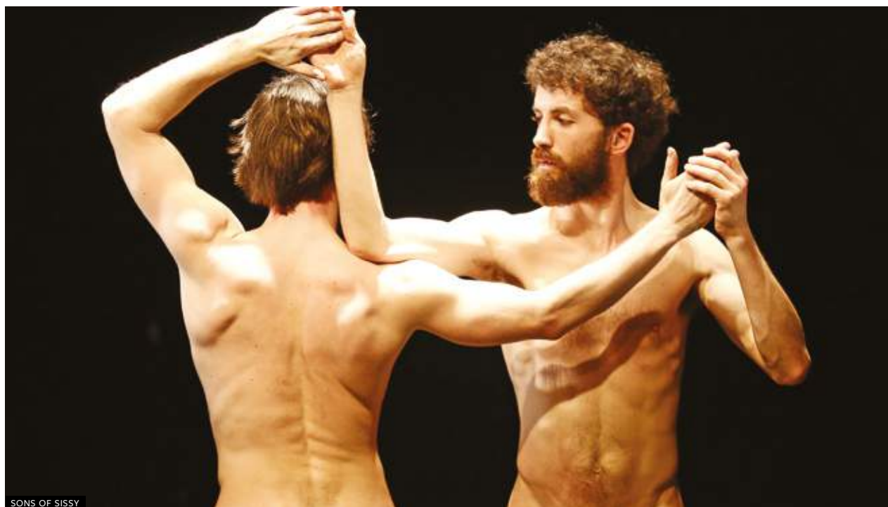
SONS OF SISSY

It's a chance of trying some of the activities presented in the last years by the disabled educators and animators from Centro Documentazione Handicap: a journey through our body, the boundaries we acknowledge or not and the pleasure it can give us.