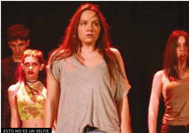
ESTO NO ES UN SELFIE