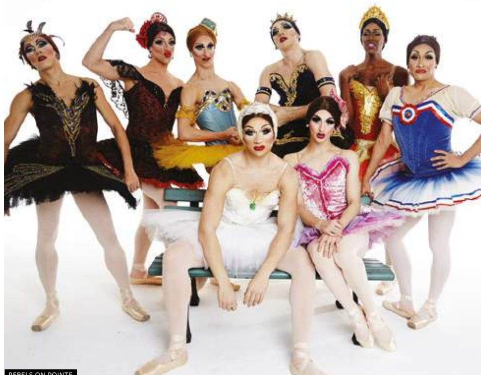
REBELS ON POINTE

che si ribella alla gravità e mostra la sua lievità: un "one woman show" ispirato alle immagini di Botero, agli anni '80 di Jane Fonda, al concetto di successo e prestazione. In R.OSA there's a revolution of the body which rebels against gravity and shows its lightness: a "one woman show" inspired by Botero's images, by the Jane Fonda 80's and by the ideas of success and high-performance.