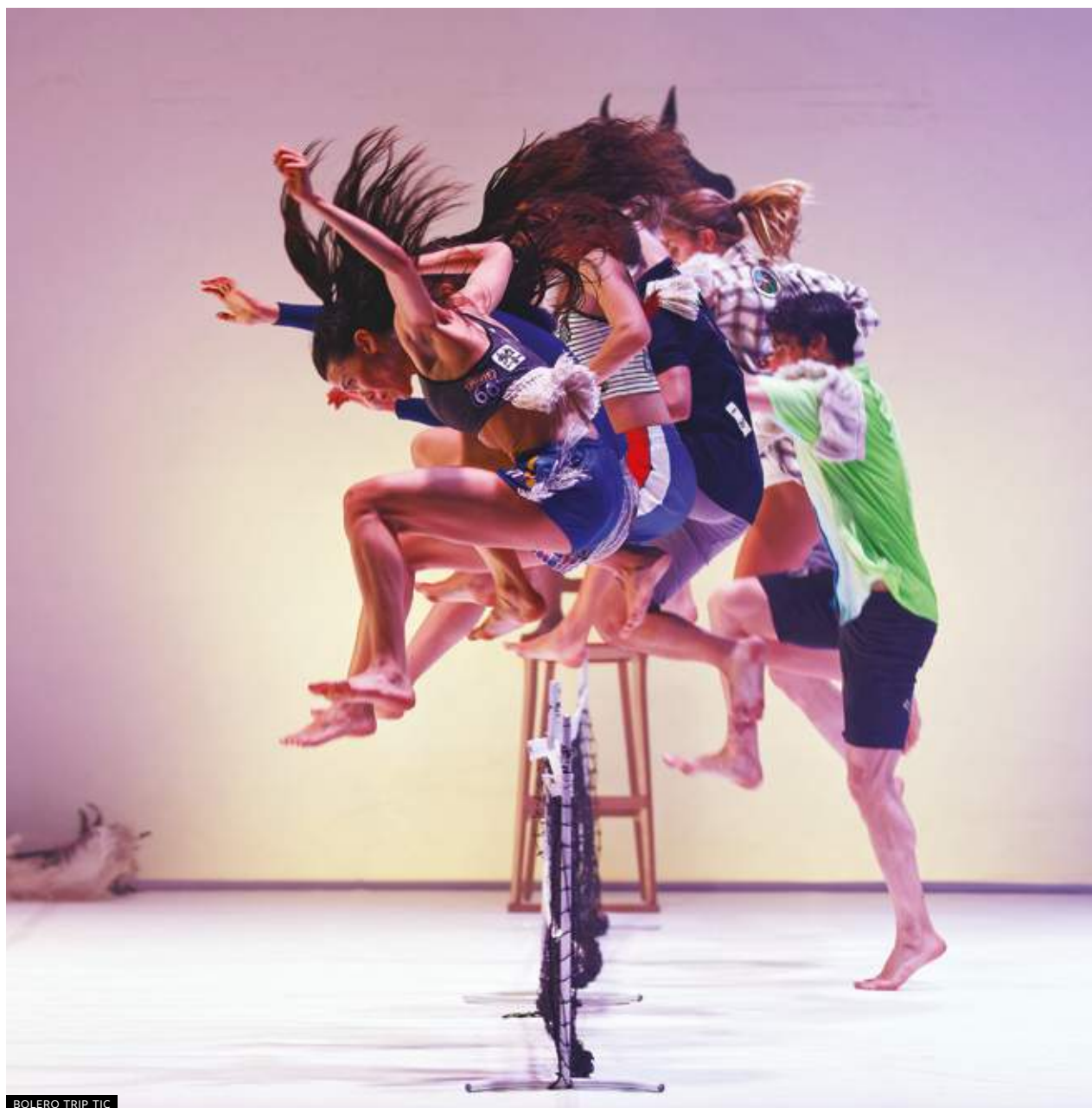
BOLERO TRIP TIC

IN APERTURA I SALUTI DELL'ASSOCIAZIONE ORLANDO