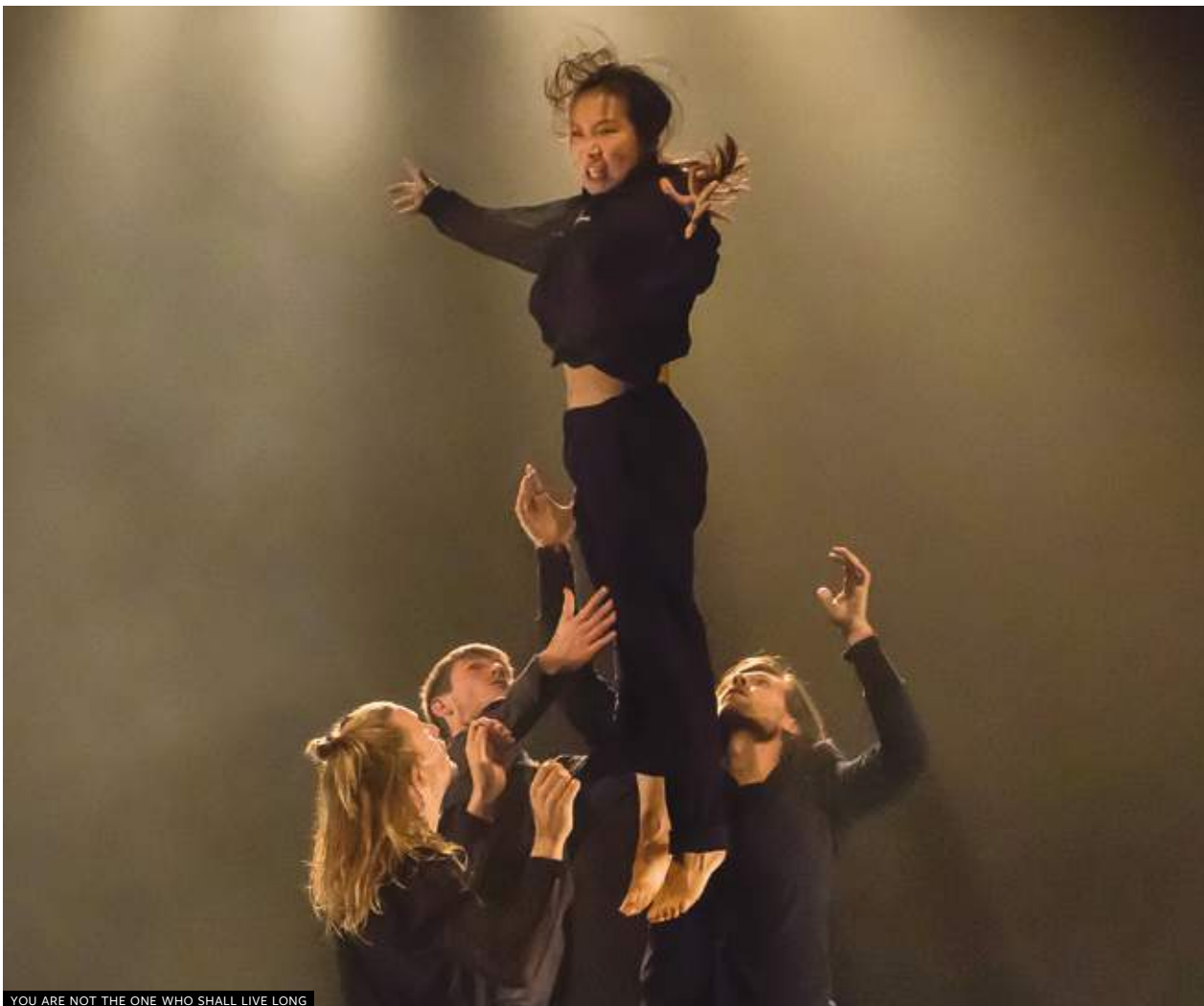
YOU ARE NOT THE ONE WHO SHALL LIVE LONG