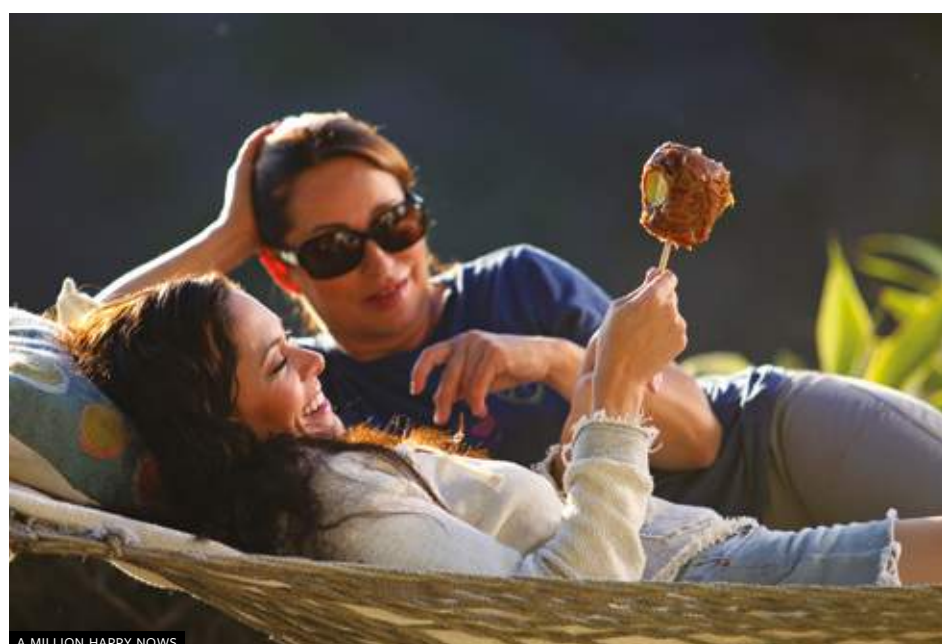
A MILLION HAPPY NOWS

After a 20-year long career as the main character in a soap opera, Lainey Allen decides to abandon show business and move to California with the woman she loves, who's also her agent. Their relationship will be strongly challenged by the early symptoms of Lainey's illness.